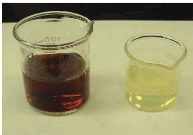
شکل ۱: تهیه عصاره الکلی بره موم

فلاونوئیدها نظیر آگلیکون فلاونوئید ۱ ، باعث جلوگیری از سرطان، فعالیت ویروس تبخال و آنفلوانزا می شود و ضد قارچ های پوستی، قارچ کاندیدیا ۲ و عامل سالمونلا ۳ است [۲، ۱]. همچنین بره موم، اصولاً یک عامل ضدبو و پاک کننده پوست، مرطوب کننده و تجدید کننده حیات و حالت ارتجاعی پوست است و نیز به صورت محافظت کننده و نگهدارنده پوست، بهبود جوش و رفع خشکی پوست و شوره سر، تبخال، اگزما، آبله، سوختگی ها، سالک، زخم های عمقی، زخم های سطحی در فرآورده های بهداشتی - آرایشی مصرف می شود. این فرآورده می تواند برای هر شخص، بدون توجه به جنسیت و سن استفاده شود [۷، ۲]. یک پزشک استرالیایی از عصاره بره موم و پماد آن برای درمان جوش ها و دیگر امراض پوستی استفاده کرد. خانمی که مبتلا به جوش عارضه دار در کل صورت بود و قبلاً از درمان شیمیایی پاسخی نگرفته بود، پس از دو هفته که تحت درمان با داروی بره موم قرار گرفت، بهبود کامل یافت [۴]. محققین در موسسه پوست نوگورد روسیه، امراض پوستی مختلف و مزمن شامل نورو درماتیت و اگزمای مزمن را با بره موم و ژله رویال درمان کردند [۷، ۸]. در یک سمینار کرم های حاوی ۲ و ۳ درصد بره موم بین ۱۶۰۰ نفر شرکت کننده توزیع شد و نتایج آن پس از یک سال جمع آوری گردید. نتایج نشان داد که رضایتمندی افراد مصرف کننده بیش از ۸۰ درصد بود. هر دو نوع کرم پوست، متعادل کننده pH و دارای خاصیت ضد باکتری، مرطوب کنندگی، استحکام و حالت ارتجاعی پوست بودند و کرم حاوی ۲ درصد بره موم دارای خاصیت ضد جوش و ضد چربی صورت بود که باعث نرمی و مخملی شدن پوست، بازسازی و احیای آن می شد [۳]. در یک بررسی تاثیر کرم بره موم با عصاره های او ۳ درصد بر درمان خشکی پوست (ترک دست و پا) انجام