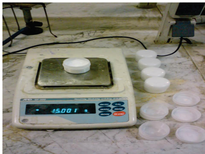
شکل ۲: توزین و بسته بندی کرم های بره موم

جهت تهیه کرم ها، به عنوان ترکیب پایه از کرم بهداشتی موجود در داروخانه ها (شامل موم سفید زنبور عسل، آب دیونیزه، پارافین مایع، اسید استتاریک، وازلین، پروپیلن گلیکول، گلیسرین، گلیسرین منواسترات، ستیل الکل، تری اتانول آمین، مواد محافظت کننده) استفاده شد و در سه تیمار نسبت ترکیب عصاره بره موم (با غلظت ۱۰ درصد) به ترتیب ۱، ۳ و ۵ درصد بود. برای بهتر مخلوط شدن مواد، ابتدا مقدار نصف کرم پایه را در مخلوط کن آزمایشگاهی ریخته و عصاره بره موم را به آن افزوده، پس از مخلوط شدن، به تدریج باقیمانده کرم را طی چند مرحله اضافه نموده تا خوب هموژن شود. سپس کرم های تهیه شده به میزان ۲۰ گرم در هر ظرف مخصوص (به شکل کاسه ای) بسته بندی شده (شکل ۲) و روی برجسب هر ظرف درصد بره موم و روش مصرف کرم را نوشته و در یخچال نگهداری شدند. هر نوع کرم در اختیار حداقل ۲۰ بیمار دارای جوش صورت قرار داده شد. جهت جلوگیری از حساسیت افراد نسبت به بره موم، توصیه شد تا مقدار کمی از کرم بره موم در قسمتی از بازو مالیده شود و چنانچه حساسیت و قرمزی پوست مشاهده نگردید، روی صورت استفاده شود [۱۰].