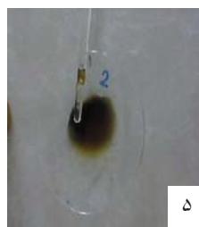
شکل (۱) تعیین نشاسته موجود در عسل تولیدی (نمونه ها از راست به چپ به ترتیب شاهد ۱۰ و ۲۰ و ۳۰ درصد نشاسته و شماره (۵) معرف می باشد).